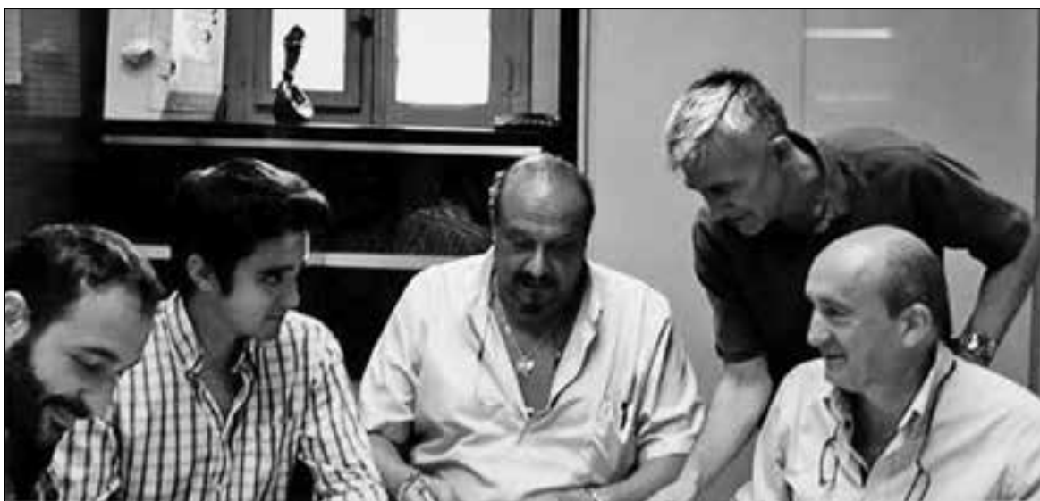
Reunión de Ciudadanos con representantes del SCMM