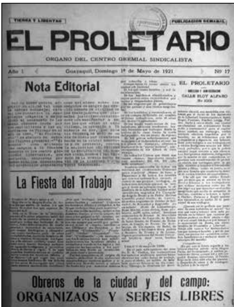
Guayaquil, 1 de mayo de 1921

Entre 1910 y 1921, los anarquistas guayaquileños centraron su actividad en la propaganda y agitación de sus ideas, se trasladaron a los barrios obreros de la ciudad (como el Astillero, en el que nacerá la poderosa Asociación Gremial del Barrio del Astillero), fundaron