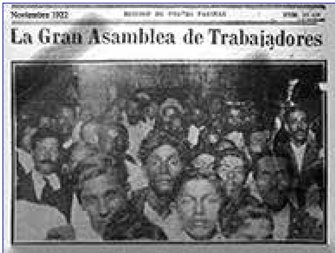
El Telégrafo. Guayaquil, 14 de noviembre de 1922. Obreros en la Gran Asamblea, un día antes de la masacre