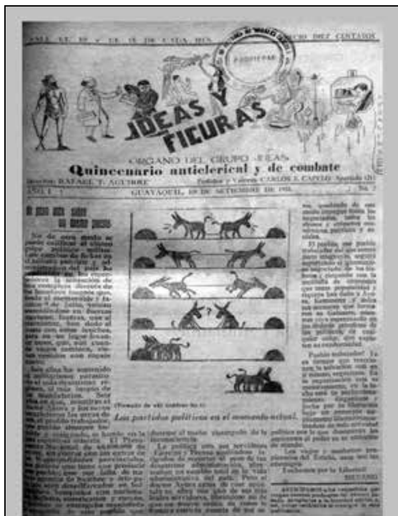
Guayaquil, 19 de septiembre de 1931